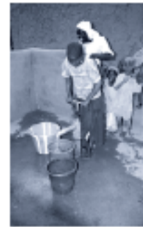
Oben: Wasserstelle alt Links: Brunnen neu