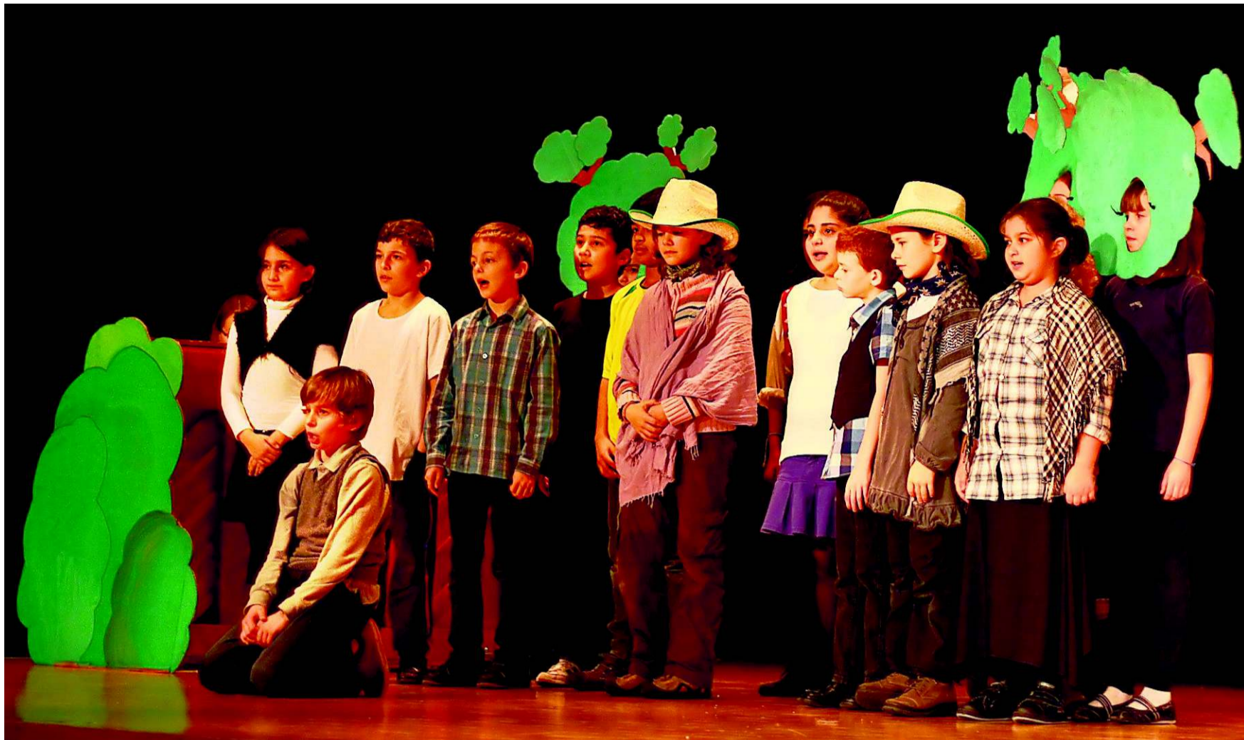
17 Dottiker Primarschülerinnen und -schüler überzeugten das grosse Publikum beim Kindermusical «Tischlein Deck Dich».

Trotz solcher Umstellungen blieb der Kern der Geschichte erhalten. Eine weitere Herausforderung für die vier war es, die magischen Aspekte realistisch auf die Bühne zu bringen. Dabei griffen die Kantonschülerinnen tief in die Trickkiste der Schauspiele-